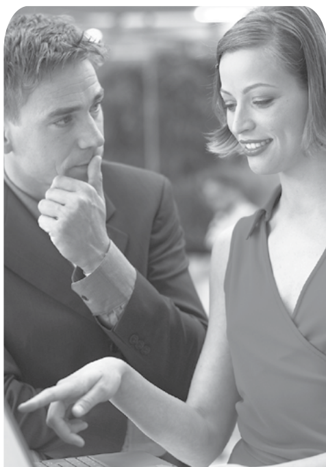
Пословни центри НСЗ

ОСТАЛО: Кандидат попуњава пријавни формулар на званичној интернет страници Министарства просвете, науке и технолошког развоја и одштампан формулар заједно са пријавом на конкурс за избор секретара са потребном документацијом доставља на адресу школе: Основна школа „Владислав Савић Јан“ Паруновац, Димитрија Туцовића 3, 37201 Паруновац, са назнаком „Пријава на конкурс“, лично или препорученом поштом. Неблаговремене и непотпуне пријаве се неће узети у разматрање, као ни пријаве које садрже фотокопије докумената које нису оверене од стране надлежног органа. Достављена документација се не враћа. Додатне информације о конкурсима могу се добити од директора школе, телефоном: 037/886-155 или путем електронске поште: osjan@ptt.rs.