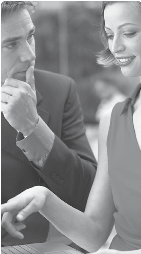
Пословни центри НСЗ

Сви изрази, појмови, именице, придеви и глаголи у овом огласу који су употребљени у мушком граматичком роду, односе се без дискриминације и на особе женског пола.