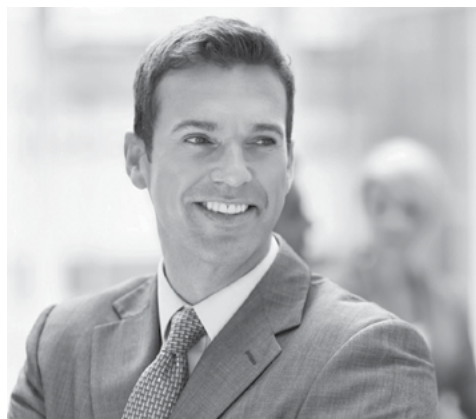
Пословни центри НСЗ

Лице које је већ запослено у Министарству одбране и Војсци Србије, а које се пријављује на јавни конкурс, уместо уверења о држављанству и извода из матичне књиге рођених подноси решење о распоређивању на радно место односно на формацијско место у органу у којем ради или решење да је нераспоређен.