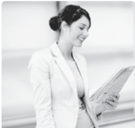
Посао се не чека, посао се тражи