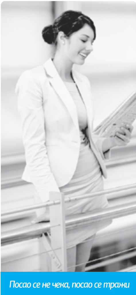
Посао се не чека, посао се тражи