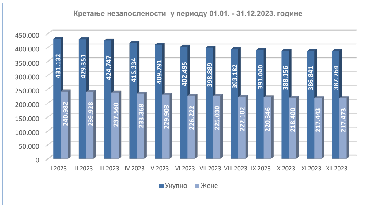
Графикон 2. – Кретање незапослености у 2023. години

У току извештајног периода, у јануару је број незапослених лица достигао свој максимум и износио је 431.132 лица, док од фебруара до марта бележи постепени пад, када достиже број од 424.747 број незапослених лица на евиденцији Националне службе. Након овог се бележи све већи пад незапослених, да би у новембру број незапослених лица достигао свој минимум од 386.841 лица на евиденцији. Просечна месечна вредност броја незапослених лица у 2023. години износи 404.977, што је за 43.641 (9,7%) лица мање него претходне године у истом периоду када је било 448.618 лица.