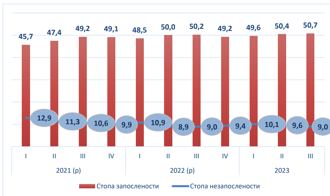
Графикон 1 – Стопе запослености/незапослености, популација узраста 15 и више година, 2021–2023. (%)

Стопа запослености за становништво узраста 15 и више година, за III квартал 2023. године износи 50,7%, и у односу на III квартал 2022. године повећана је за 0,5 процентних поена, док је у односу на II квартал 2023. године повећана за 0,3 процентна поена.