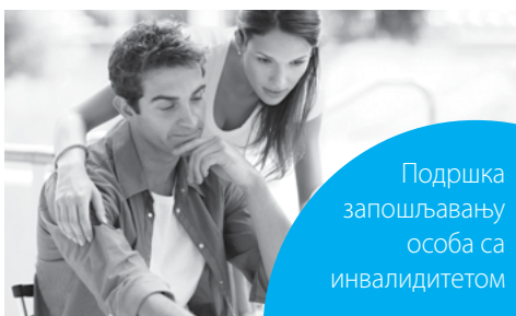
Поддршка запошљавању особа са инвалидитетом

ОСТАЛО: Кандидати уз пријаву на конкурс достављају: оверену копију дипломе доктора наука из одговарајуће научне области; биографију са неопходним елементима за писање Извештаја; списак стручних и научних радова, као и саме радове; доказ о неосуђиваности (МУП). Пријаве се примају у року од 8 дана од дана објављивања конкурса, на горе наведеној адреси. Контакт телефон: 021/450-188, локал 124.