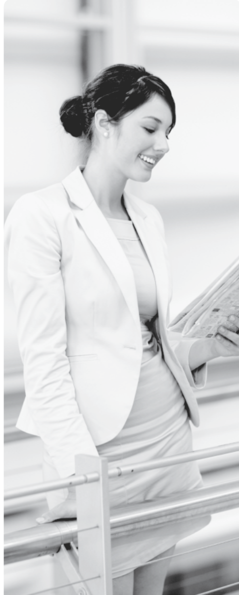
Посао се не чека, посао се тражи