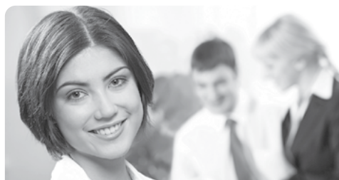
Посао се не чека, њосао се њражи

ОСТАЛО: Рок за подношење пријава је 8 дана од дана објављивања огласа у публикацији „Послови“, путем поште или лично предати на писарницу Дома здравља Шид.