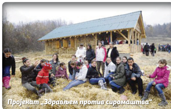
Пројекат „Здрављем против сиромаштва“

Социјално предузеће „Еко бег“ производи модерне торбе од рециклираног материјала, а основни циљ је запошљавање дугорочно незапослених жена старијих од 50 година. Шарене торбе, фасцикле и новчанике праве од билборда, тј. од ПВЦ фолије коришћене у бројним рекламним кампањама. Сарађују са домаћом банком која наручује кесе за своје конференције, али и са градском управом, невладиним сектором и још неким фирмама.